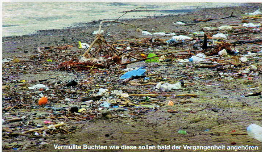
Vermüllte Buchten wie diese sollen bald der Vergangenheit angehören

Neu ist auch die Möglichkeit, über die mySea-App Liegeplätze zu reservieren. Weitere Informationen: www.my-sea.com